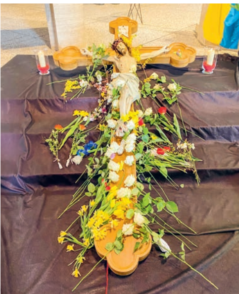
Das Karfreitagskreuz in Teufen aus dem letzten Jahr: Blumen als Zeichen der Hoffnung

Die Karfreitagsliturgie öffnet den Blick ins Leid dieser Welt, das Menschen erleben: Der Krieg in der Ukraine und an anderen Orten weltweit, Klimawandel und Naturkatastrophen ... Die Kreuze, wo und wie auch immer sie noch heute aufgerichtet werden, lassen sich nicht zählen! Blumen, welche Sie in den Gottesdienst mitbringen mögen, werden zum Leidenskreuz gelegt.