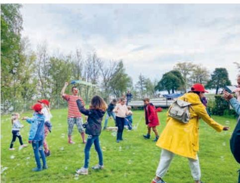
Ausflug nach Goldach mit ukrainischen Schutzsuchenden am Samstag, 30. April –... Unbeschwerter Zeit am See ...