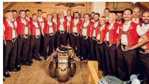
Der Jodelclub Teufen gestaltet den Gottesdienst zum 1. Advent mit.

Der Advent ist die Zeit des vorweihnachtlichen Erwartens. Zu den Erwartungen der heutigen Zeit machen sich die Seelsorgenden Gedanken, und zwar anlässlich des ökumenischen Adventsgottesdienstes am Sonntag, 27. November, um 10.00 Uhr, in der kath. Kirche Stofel in Teufen. Der Jodelclub Teufen gestaltet den musikalischen Rahmen zu dieser besonderen Feier zum Auftakt des diesjährigen Advents. Im Anschluss sind alle zu einem einfachen Suppenmahl eingeladen.