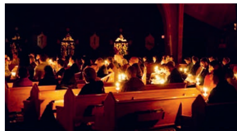
Noch immer finden Kinder und Erwachsene frühmorgens den Weg zur Rorate.

Dienstags und mittwochs im Advent läuten frühmorgens um 6.30 Uhr die Kirchenglocken in Teufen und Bühler und laden ein zur Roratefeier, der besinnlichen «Frühschicht» im Advent. Mit Kerzenlichtern, Geschichten, gehaltvoller Musik und kurzen Texten gestalten die Liturgen mit den Religionslehrerinnen